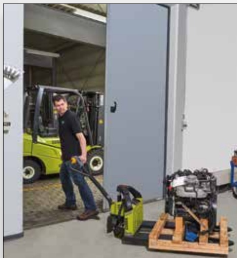
Ideal para el uso en aplicaciones industriales