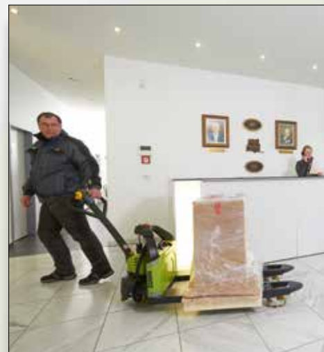
Ideal para el uso en logística y comercio minorista